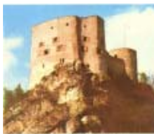
Aaburg bei Brühl