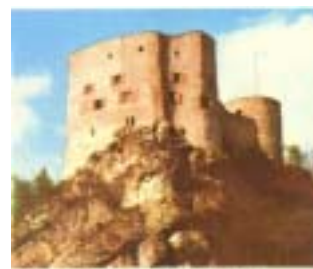
Ab Pfaffen bei Bristel