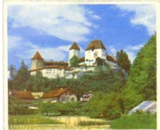
Le château de Berthoud

La bière a peu d'alcool - elle est bonne et fait du bien