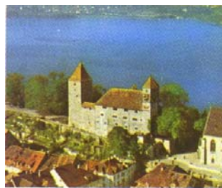
Le château de Rapperswil