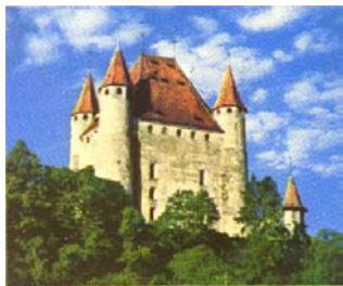
Le château de Thoun