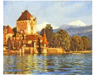
Le château d'Oberhofen