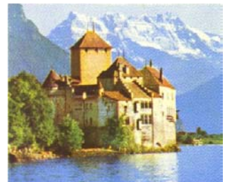
Le château de Chillon