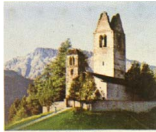
Eglise S. Gian