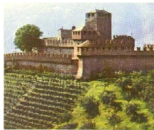
Castello Svitto Bellinzona