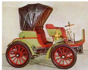
Weber, 1902 (Schweiz)