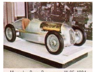
Mercedes-Benz, Rennwagen W 25, 1934 (Deutschland)