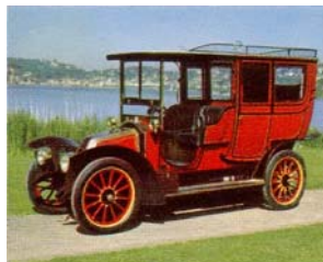
Renault, 1908 (Frankreich)