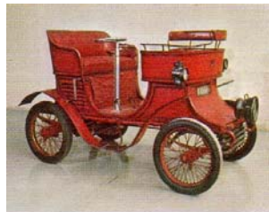
Berna, Typ Ideal, 1902 (Schweiz)