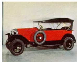
Pic-Pic, 1919 (Schweiz)