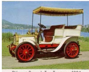
Clément-Bayard, Typ Tonneau, 1904 (Frankreich)