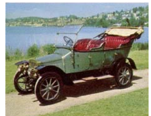
Adler, Typ K 5/11, 1912 (Deutschland)