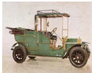
Ajax, 1908 (Schweiz)