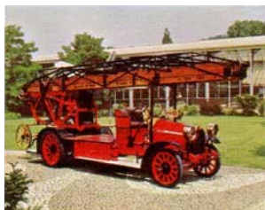
Saurer Feuerwehrauto, 1913 (Schweiz)