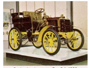
Panhard et Levassor, Typ B 1, 1902 (Frankreich)