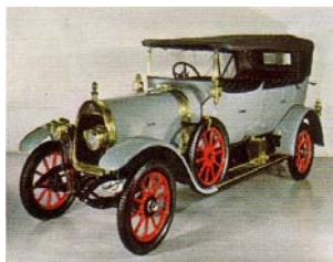
Fischer, Ventilios, 1913 (Schweiz)