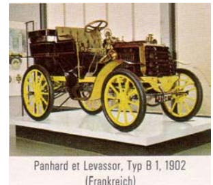
Panhard et Levassor, Typ B 1, 1902 (Frankreich)