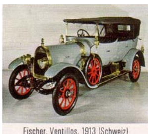
Fischer, Ventilios, 1913 (Schweiz)