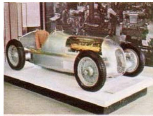
Mercedes-Benz, Rennwagen W 25, 1934 (Deutschland)