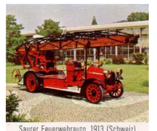
Saurer Feuerwehrauto, 1913 (Schweiz)