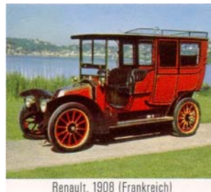
Renault, 1908 (Frankreich)