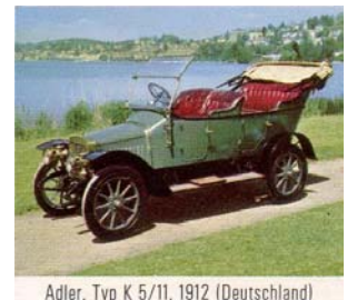
Adler, Typ K 5/11, 1912 (Deutschland)