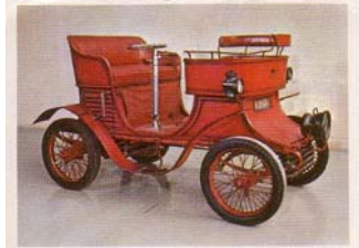
Berna, Typ Ideal, 1902 (Schweiz)