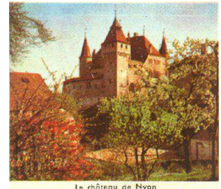
Le château de Nyon