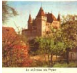
Le château de Pysin