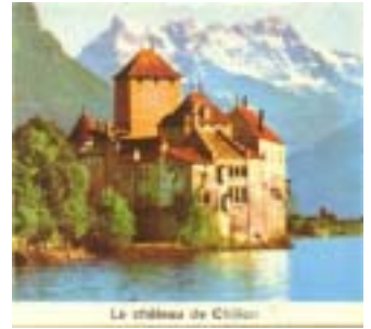
Le château de Chillon