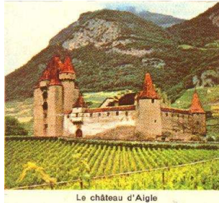
Le château d'Aigle