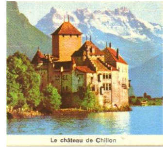
Le château de Chillon