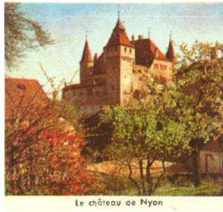
Le château de Nyon