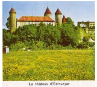
Le château d'Estavayer