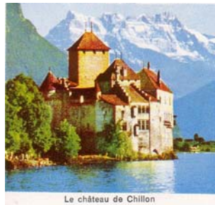
Le château de Chillon