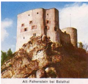
Alt-Falkenstein bei Balsthal