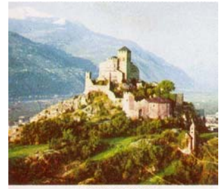
Le château de Sion