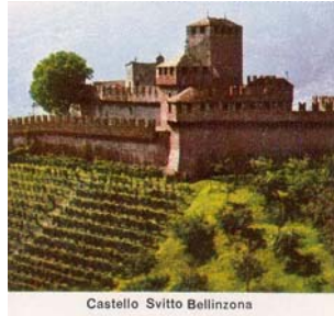
Castello Svitto Bellinzona