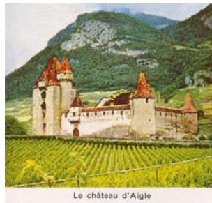
Le château d'Aigle