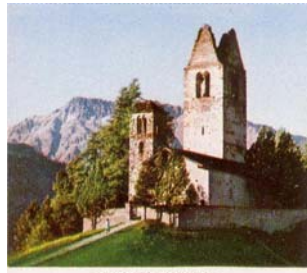
S. Gian bei Celerina