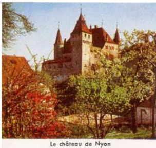
Le château de Nyon