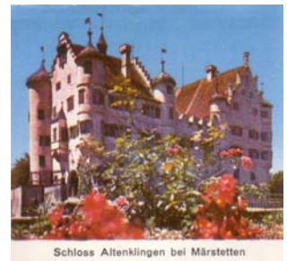
Schloss Altenklingen bei Märstetten