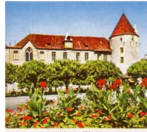
Le château d'Yverdon