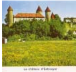
Le chateau d'Estreyer