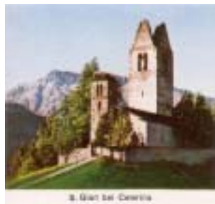
St. Gall bei Coarile