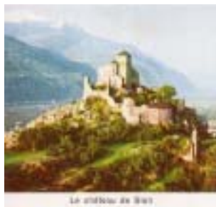
Le château de Sion