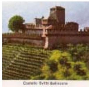
Castello Svitto Bellinzona