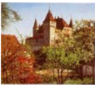
Le château de Hohen