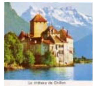
Le château de Chillon