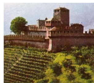
Castello Svitto Bellinzona