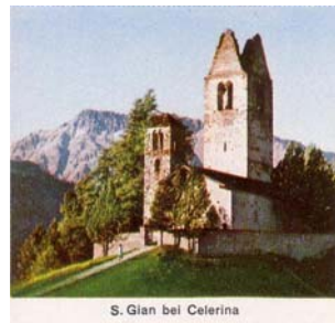
S. Gian bei Celerina