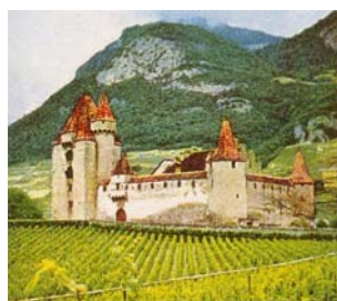
Le château d'Aigle