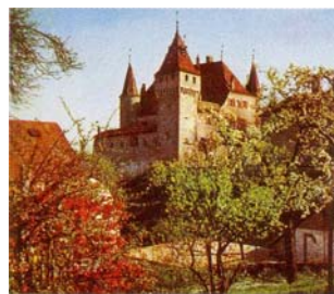
Le château de Nyon