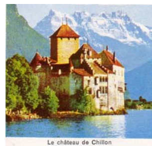
Le château de Chillon