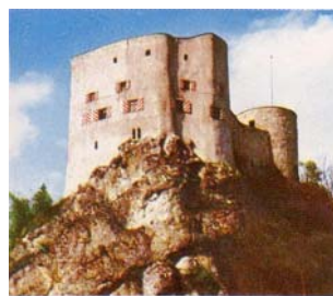
Alt-Falkenstein bei Balsthal