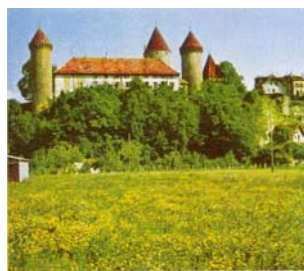
Le château d'Estavayer