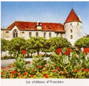
Le château d'Yverdon