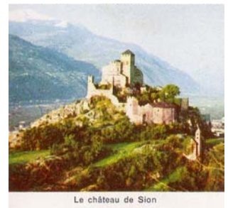
Le château de Sion