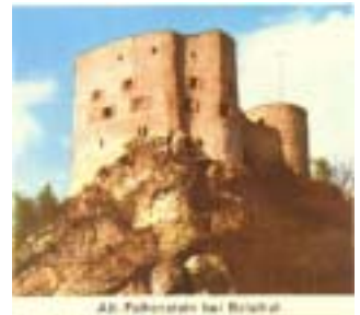
Alte Paderborn bei Betschwil