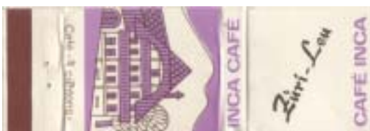
TAB00096-11 mit Goldaufdruck „Züri-Leu“