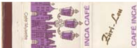
TAB00096-9 mit Goldaufdruck „Züri-Leu“