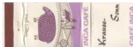
TAB00096-12 mit Goldaufdruck „Krause-Senn“