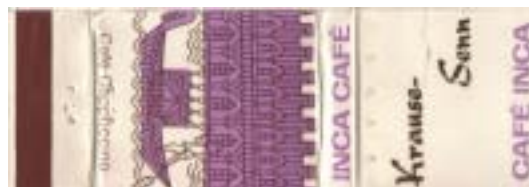
TAB00096-10 mit Goldaufdruck „Krause-Senn“