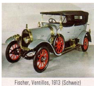
Fischer, Ventillos, 1913 (Schweiz)