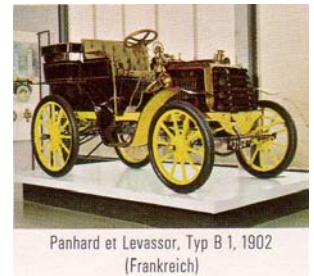
Panhard et Levassor, Typ B 1, 1902 (Frankreich)