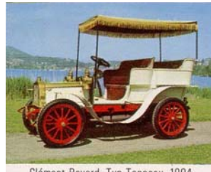
Clément-Bayard, Typ Tonneau, 1904 (Frankreich)