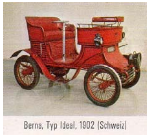
Berna, Typ Ideal, 1902 (Schweiz)