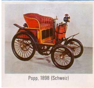
Popp, 1898 (Schweiz)