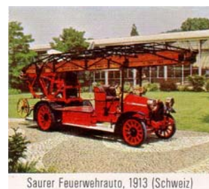
Saurer Feuerwehrauto, 1913 (Schweiz)