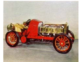
Dufaux-Rennwagen, 1905 (Schweiz)