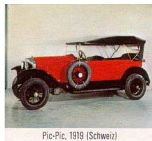
Pic-Pic, 1919 (Schweiz)