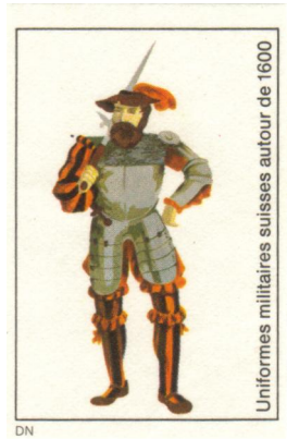
Uniformes militaires suisses autour de 1600