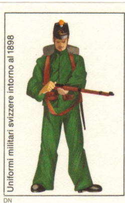
Uniformi militari svizzere intorno al 1898