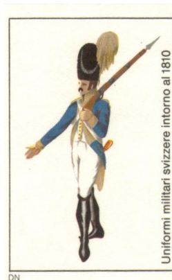
Uniformi militari svizzere intorno al 1810