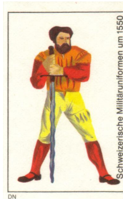
Schweizerische Militäruniformen um 1550