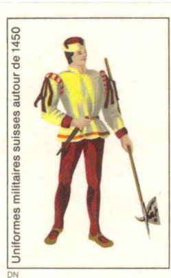
Uniformes militaires suisses autour de 1450