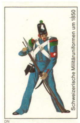
Schweizerische Militäruniformen um 1850