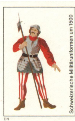
Schweizerische Militäruniformen um 1500