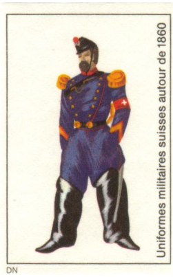
Uniformes militaires suisses autour de 1860