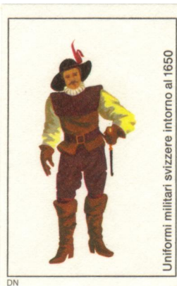
Uniformi militari svizzere intorno al 1650