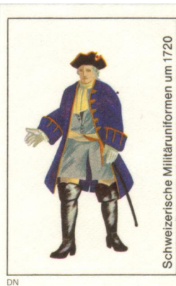
Schweizerische Militäruniformen um 1720