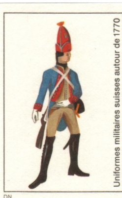
Uniformes militaires suisses autour de 1770