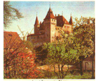
Le château de Nyon