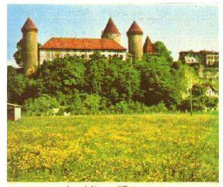
Le château d'Estavayer