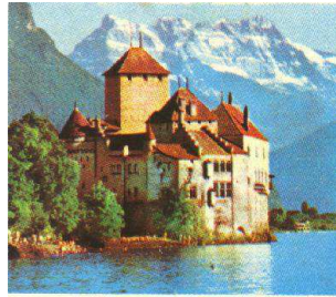
Le château de Chillon