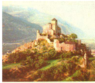
Le château de Sion