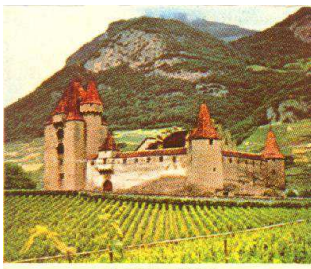
Le château d'Aigle